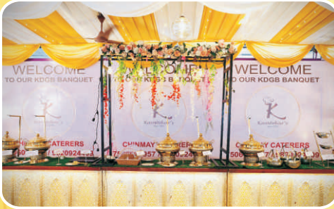
अत्याधुनिक बुफे काउंटर