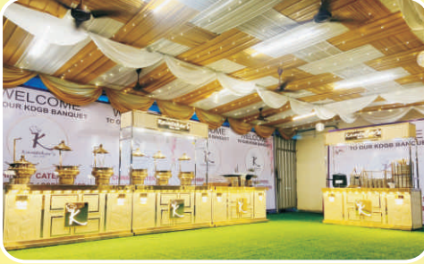
आकर्षक भोजन कक्ष