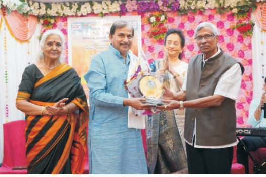
स्वर वसंत - संगीतमय कार्यक्रम