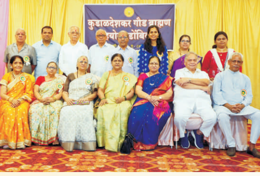
कौतुक आणि कृतज्ञता सोहळा