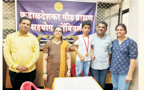
बुद्धीबल आणि कॅरम स्पर्धा